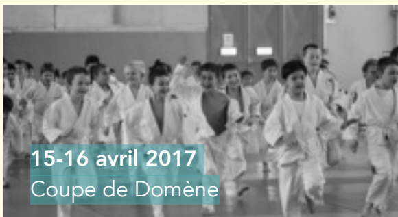
15-16 avril 2017 Coupe de Domène