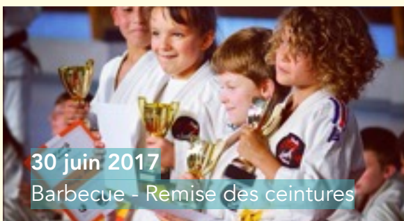
30 juin 2017 Barbecue - Remise des ceintures