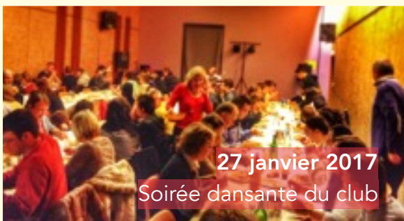
27 janvier 2017 Soirée dansante du club